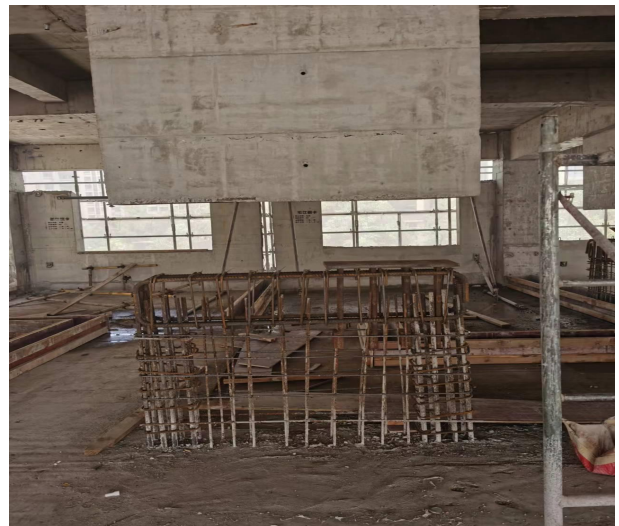
F) 浇筑混凝土，下墙墩施工