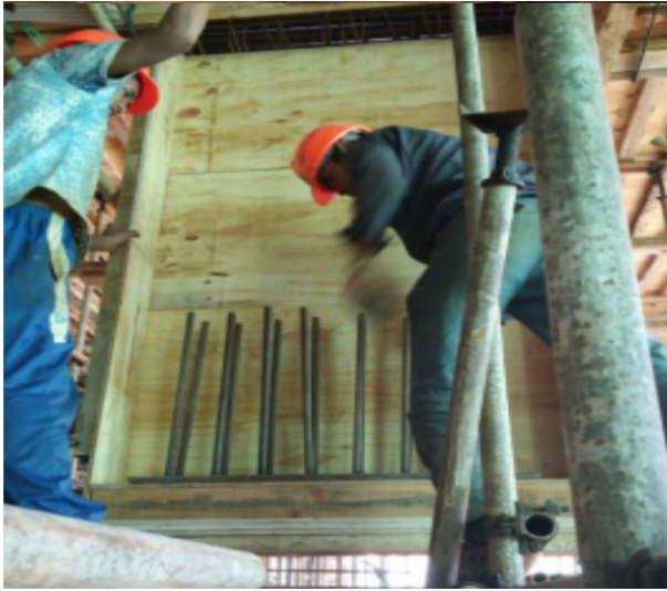
A) 定位后放置预埋件