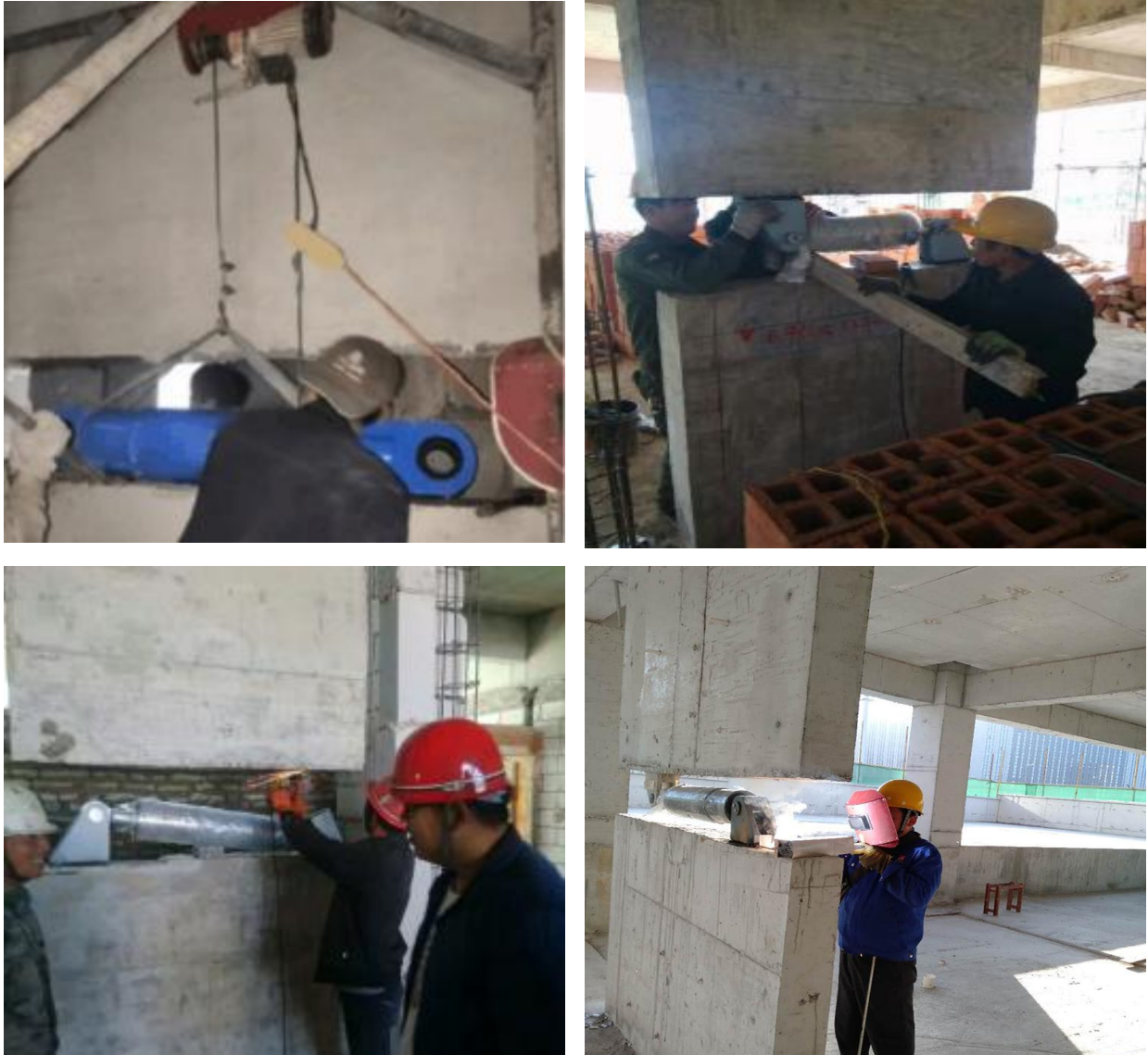
图 7 VFD 阻尼器吊装及焊接安装