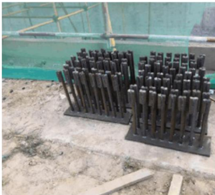
图 2 VFD 预埋件示意图