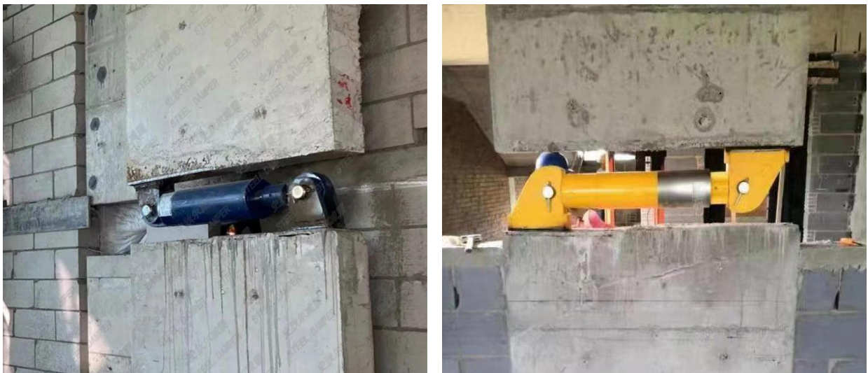
图 8 节点板防锈处理