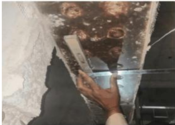
图 5 VFD 阻尼器连接板定位、校正及安装