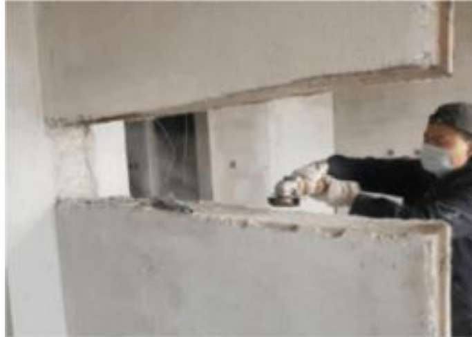
图 4 清理打磨预埋件