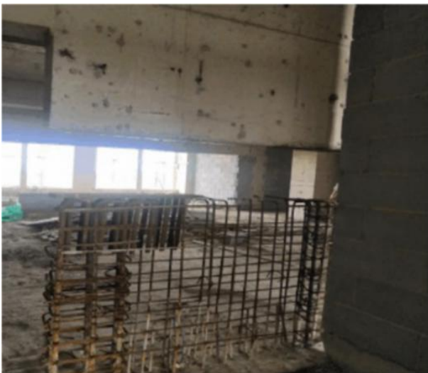
E) 浇筑混凝土，下墙墩施工